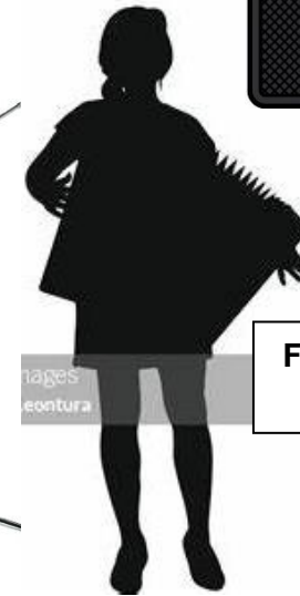
Fanfan accordéon + chant