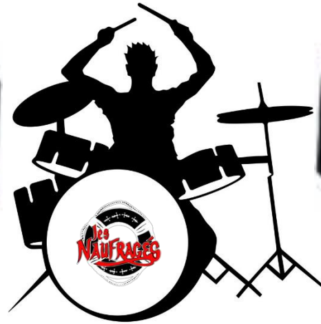
Samy Batterie + Choeurs