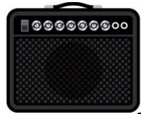
David Guitare électrique + Choeurs